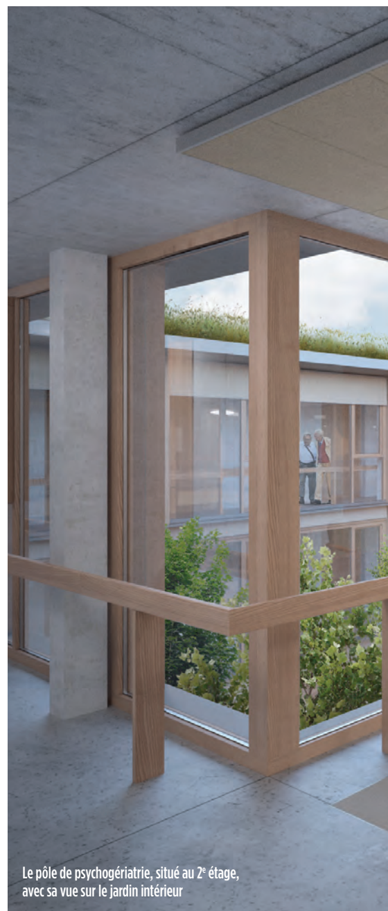
Le pôle de psychogériatrie, situé au 2 e étage, avec sa vue sur le jardin intérieur

La cour intérieure permet un dialogue étroit entre les espaces de vie communs ainsi qu'un rapport intérieur-extérieur permanent du fait de l'ouverture sur le paysage des espaces de vie principaux. Cette organisation permet aussi de sortir d'un schéma hospitalier de type couloir-chambre. Les espaces de déambulation sont également des espaces de vie.